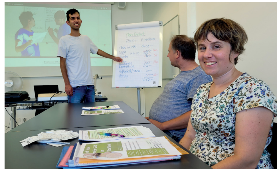
Formation continue de tuteur-trice

À l'externe: les chiffres et faits (résultats de la mesure d'impact) démontrent que la contribution financière diminue considérablement lorsqu'une personne a suivi une formation au sebit. En effet, la formation renforce la personne par le biais de ses compétences et de son niveau d'éducation.