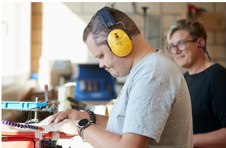
Un employé de la fondation Domino est accompagné par une responsable de groupe/assistante.

Les défis auxquels sont confrontées les personnes handicapées sont multiples. Souvent, l'assistance et le soutien qui leur sont apportés sont insuffisants pour répondre adéquatement à leurs besoins et à leurs désirs. C'est là qu'intervient le projet